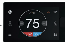
Thermostat intelligent EcoNet