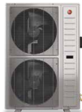
5 tonnes RD17AZ60AJ3NA