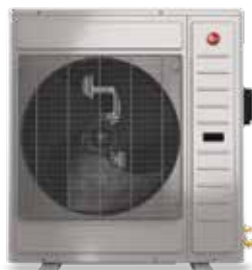
3 tonnes RD17AZ36AJ3NA