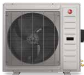
2 tonnes RD17AZ24AJ3NA