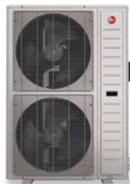
4 tonnes RD17AZ48AJ3NA